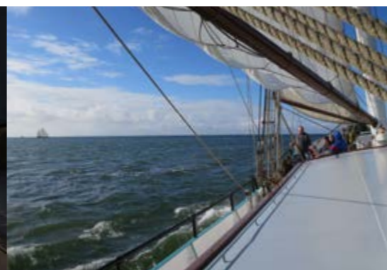
VOR UNS DAS MEER 8.9. - 13.9.2024