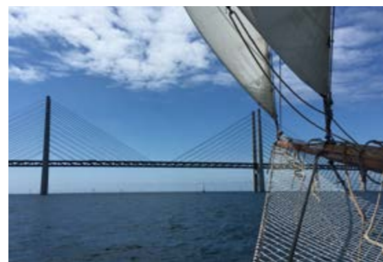
LEINEN LOS! 6.9. - 8.9.2024