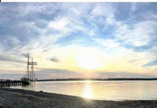
WOCHENEND & SONNEN- SCHEIN 7.6. - 9.6.2024