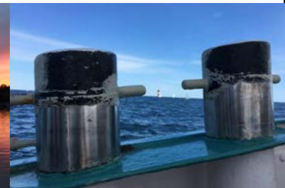
SONNE, WIND & MEER 9.6. - 14.6.2024